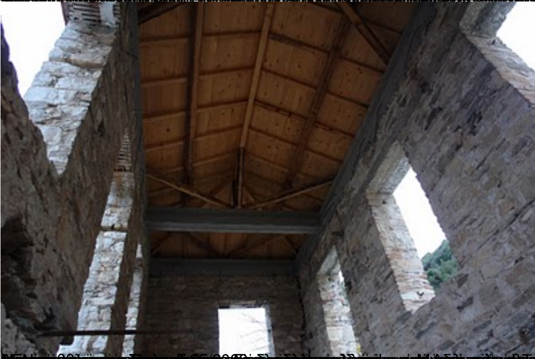
Προξενείο του 19ου αιώνα