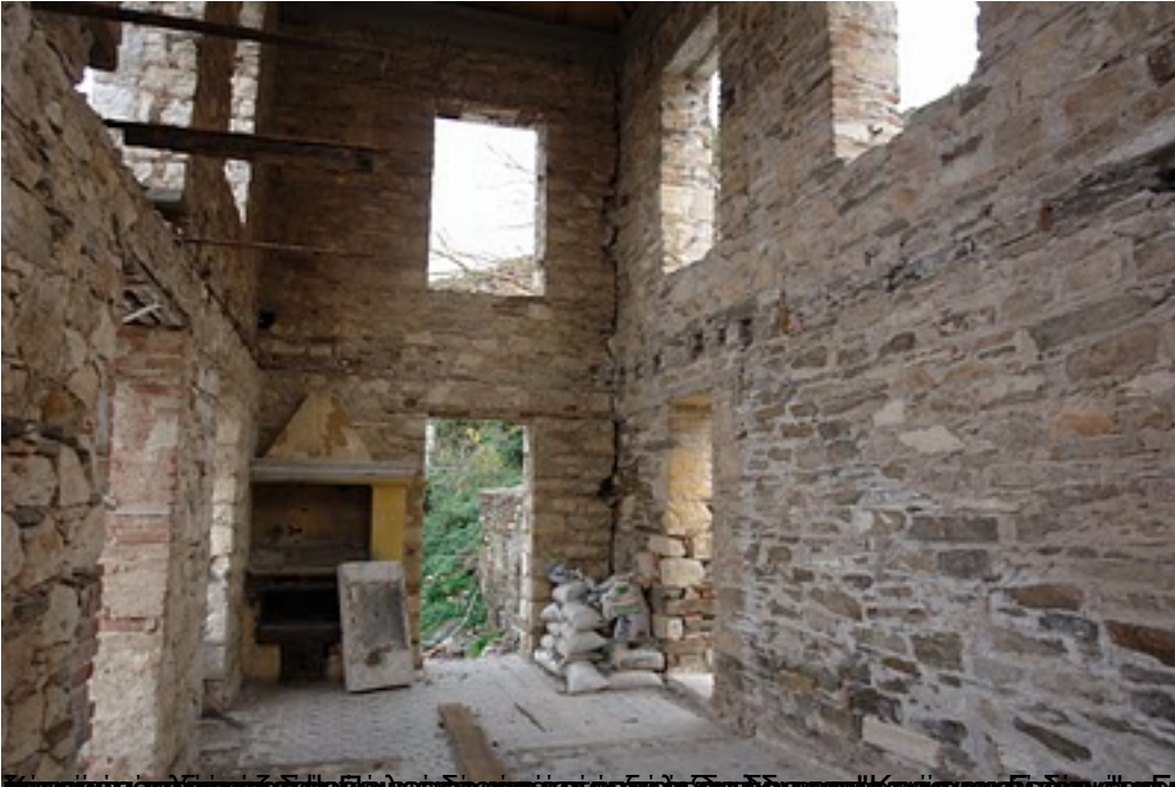
Προξενείο του 19ου αιώνα